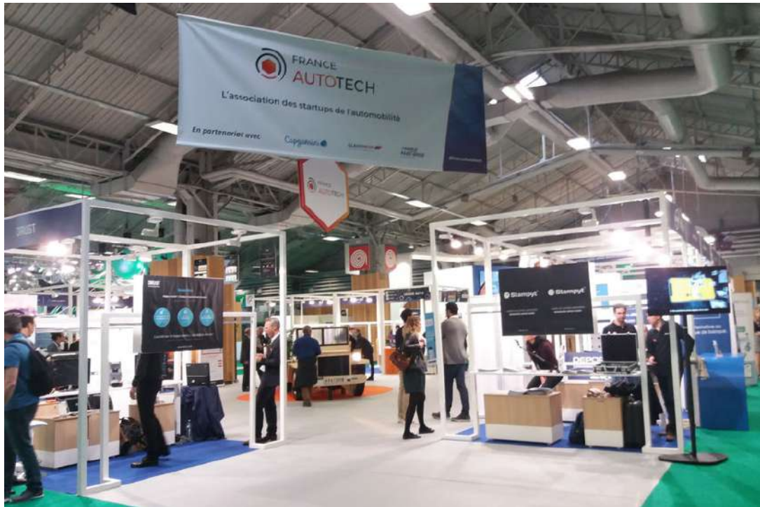
France AutoTech dispose d'un stand de 300 m2 dans le hall mobilité du Mondial de l'auto.

start-up françaises de l'auto-mobilité, profite du Mondial de l'auto pour se montrer. Créée il y a un an, cette association fédère aujourd'hui une trentaine de jeunes pousses et espère avoir plus de poids pour faire porter leurs idées auprès des pouvoirs publics ou des grandes entreprises.