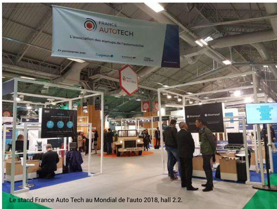
Le stand France Auto Tech au Mondial de l'auto 2018, hall 2.2.

| Par Justine Pérou | Publié le 04/10/2018 à 13:39. Mis à jour le 04/10/2018 à 17:31